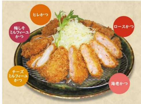
※写真は3名様用です

「GW 限定 春のファミリーかつ」は、かつアンドかつ自慢のロースかつ・ヒレかつに加え、海老かつ・梅しそミルフィーユかつ・チーズミルフィーユかつなどのイチオシ商品をバラエティ豊かに盛り合わせた、ご飯・味噌汁・キャベツ・漬物付きのセットです。レギュラーメニューの「ファミリーかつ」には、“海老フライ”がセットされていますが、今回は特別に“海老フライ”を“海老かつ”に変更したセットにしました。“海老かつ”は、3月1日から開催している春の旬味フェアの商品として新発売し、多くのお客様にご好評いただいています。春を彩る桜海老・バナメイ海老・甘海老を使用し、つなぎなしで仕上げたプリプリ食感が自慢です。ゴールデンウィークのお食事に、ぜひ、かつアンドかつをご利用ください。